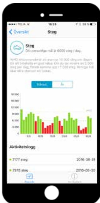
Patient och vårdgivare kan se antal steg som patienten har tagit över tid.