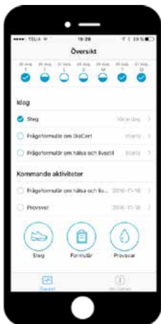
Patient och vårdgivare sätter tillsammans patientens personliga mål.